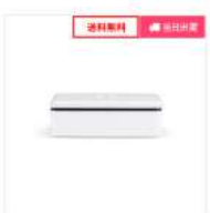
【除菌ボックス】S2 UVC LED HYGIENIC (スクエ ア)