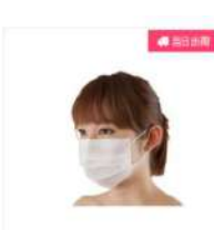
三层フェイスマスクSP ホ ワイト 50枚入り