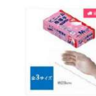
NO.807 ビニール極薄手 バウダーフリー 100枚入り (グローブ)