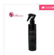
【あすなる】 HYBRIDSPRAY 室内用 200ml