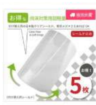
【松風】ディスプレイザブル 飛沫対策用超軽量Faceガ ードシールドのみ