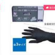
ニトリノロング300 プラ ック 50枚入り (グロー ブ)