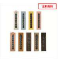
殺菌スリッパ保管庫バリ ューシリーズ キュート8足 右取手