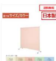
1連サンカート (高さ 120/150/180cm/幅