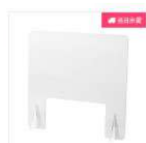
飛沫感染対策アクリルパー テーション