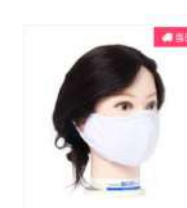
洗って使えるマスク ホワ イト 1枚入り