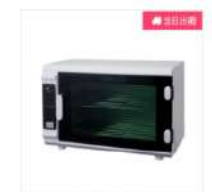
紫外線消毒器NV- 208EX (PHILIPS社製ライ ト採用)