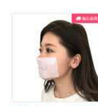
【New】まつく(貼る マスク) 100枚入り