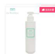
【eye Boutique】ハンド ジュレ(アグリーム) 150ml