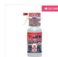
整髪ウィルコース コー キングスプレー 490ml